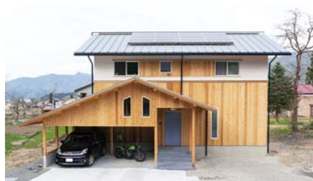
周囲の自然風景と調和する佇まい。太陽光発電で売電収入も期待できるほか、地熱を利用したヒートポンプで経済的な冷暖房を実現する。