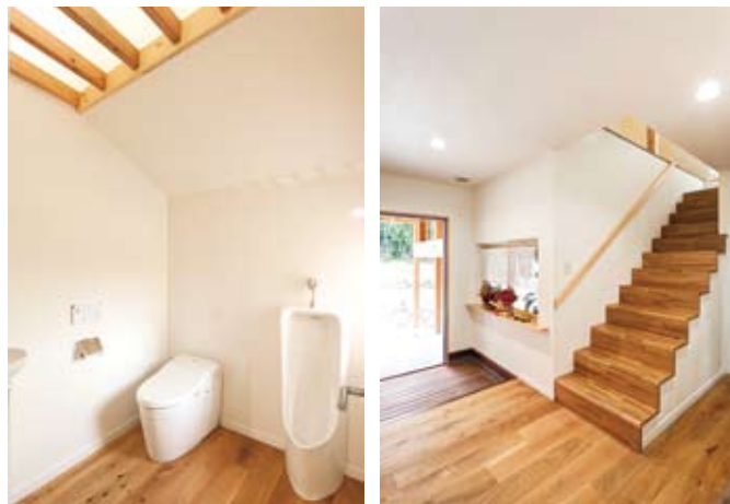
左/天井のアクリルガラスを通して、2階ホールからの光が空間を柔らかく照らす。右/玄関の三和土(たたき)も板張りにこだわった。また、階段は踏み板と蹴込み部分を一体にして、すっきりとしたデザインに。

魚沼の自然豊かな里山に抱かれた0邸。その風景と調和する板張りの住まいに一步足を踏み入れると、木の香りあふれる爽やかな空間が広がっていました。「木の質感にこだわり、随所に無垢材や集成材を使ってみました」(ご主人)。 窓から八海山を望むLDKは、オープンなキッチンを採用して、広々と使えるようにしました。構造を現しにした天井や、収納棚・建具からも木の優しさが感じられます。 また、地中熱ヒートポンプや太陽光発電設備など、自然エネルギーを使ったエコで経済的な設備も導入。木の温もりと最新設備が融合した、人にも地球にも優しい快適な住まいに、家族の明るい笑顔が集います。