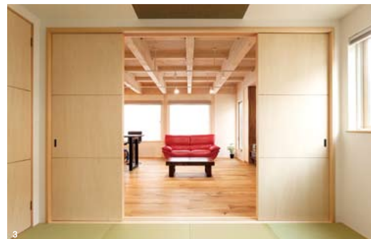
1 広々とした勾配天井の2階ホール。カウンターを備えて、お子様たちが勉強できるスペースにした。アクリルガラスの下にはトイレが配置されている。 2 キッチンと直線的に並ぶダイニング。TVボードの両サイドには木の質感を生かした収納棚を造作した。 3 和室から眺めるリビング。ご主人力作のテーブルやTVボードなどが並ぶ。