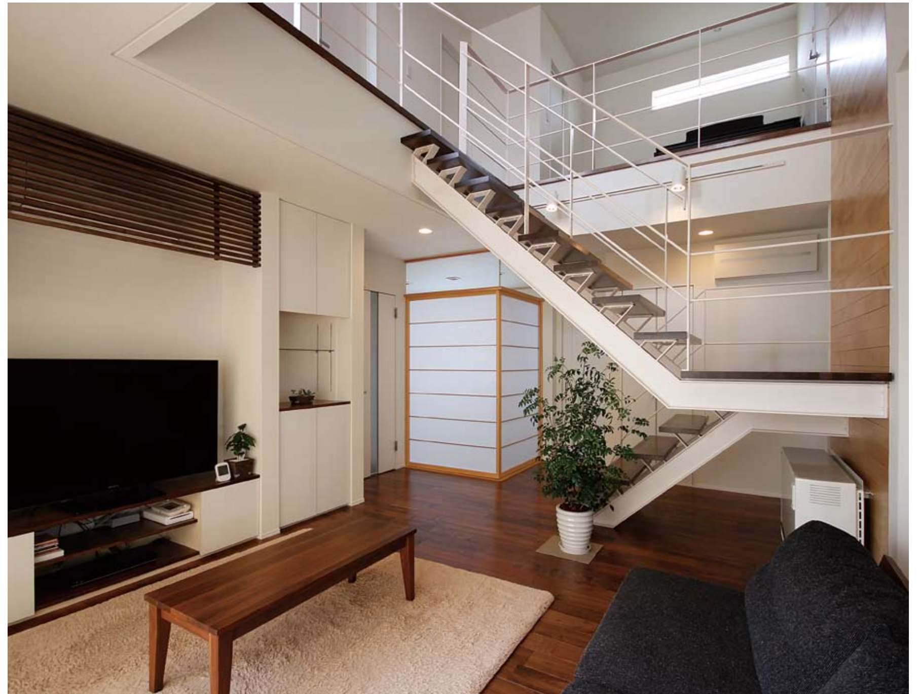
スチールのスケルトン階段が印象的なリビング。上部は吹き抜けにして、上階からの光をたっぷり取り込めるようにした。