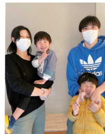
▲家族みんなで壁塗りしました♪

長いアパート暮らしの中で、元気のいい2人の息子の成長と共に手狭に感じるようになり、マイホームの夢をもつようになりました。家づくりについて勉強を始め、高気密高断熱住宅に興味をもち、この地域の気候に合わせた家づくりをしているトピアホームさんにお願いすることにしました。私たち家族のことを考え、よりよい家にするために、本当に親身になってくださいました。また、打ち合わせの際に大騒ぎしている息子達を社員の皆様がかかるがわるがわる相手をしてくださったことには本当に感謝です。これからこの家と共に作り上げていく新しい生活が楽しみです。