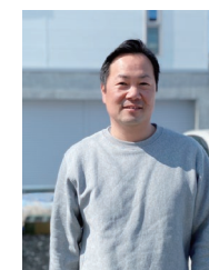
桐生 悟 satoru kiryu